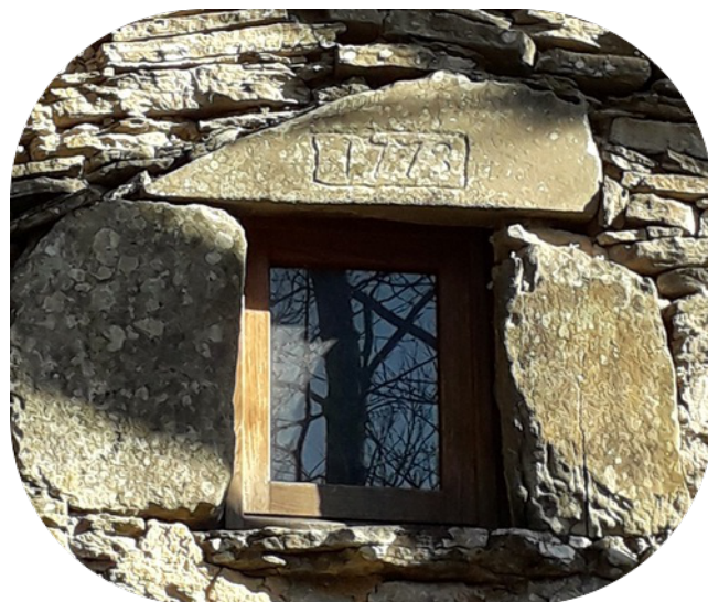
1773 – Scritta incisa

AREA SOSTA: Presso questo seccatoio è presente un'area di sosta.