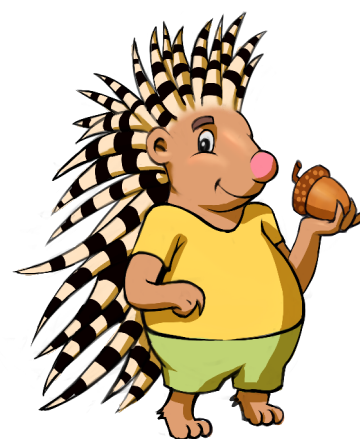
Spillo – l'istrice curiosa

Sarà l'istrice 'Spillo' ad accompagnare i bambini lungo il percorso espositivo, con tante divertenti attività.