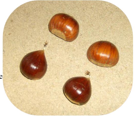
Castagne e marroni

Da notare le pareti interne ancora annerite dalla fuliggine e lo sperone di roccia sul quale è stato costruito il seccatoio, ben visibile sia sul pavimento che su alcune delle pareti interne.