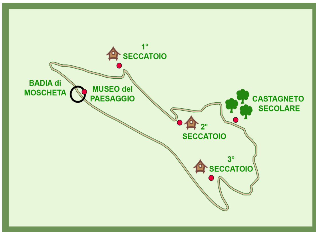
Mappa del sentiero

Percorso ad anello intorno a Moscheta, che attraversa uno dei castagneti più suggestivi del parco Giogo - Casaglia e tocca una serie di piccoli seccatoi (1) .